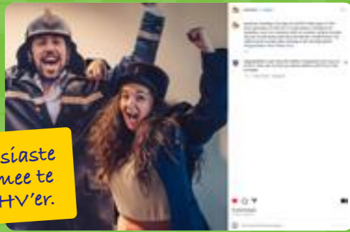
Een enthousiaste oproep om mee te doen als BHV'er.

In deze wall of fame vind je een overzicht van een aantal initiatieven en activiteiten die deelnemende organisaties in 2023 online hebben gedeeld. #dvdbhv #dagvande bhv