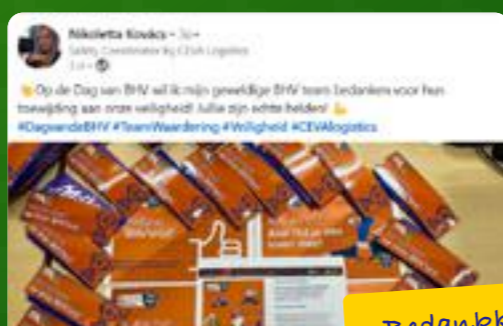
Bedankkaartjes voor de geweldig BHV-teams. Samen oefenen voor een veilige werkomgeving.