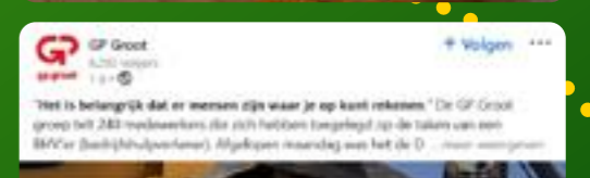
Het is belangrijk dat er mensen zijn, waar je op kunt rekenen