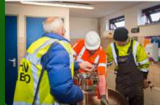
BHV'ers in de spotlights: zeer verdiend