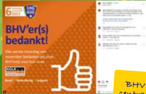
BHV'ers staan centraal deze dag