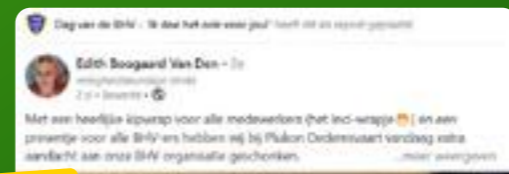
De catering zorgt ervoor dat iedereen weet dat het vandaag de Dag van de BHV is.